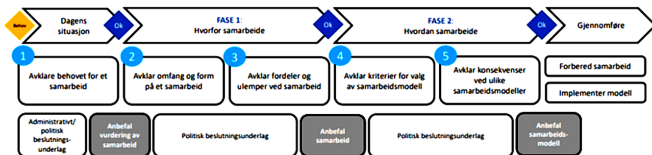
Figur 1: Prosess for å etablere et interkommunalt samarbeid.

En slik gjennomføring vil kunne sikre at begge kommuner er omforent om formålet med samarbeidet og at innhold og tidsplan er forankret.